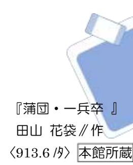
『蒲団・一兵卒』 田山 花袋//作 〈913.6/イ〉 本館所蔵