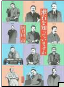
『漱石を知っていますか』 阿刀田 高//著 〈910.2/7〉 本館所蔵