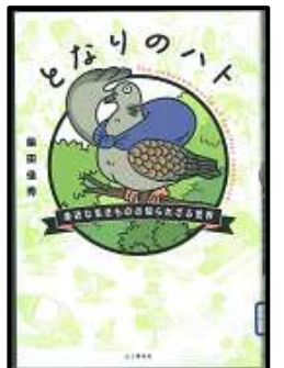
『となりのハト』 〈488.4/シ〉 本館所蔵