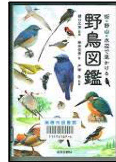
『街・野山・水辺で見かける野鳥図鑑』 〈488.2/シ〉 本館所蔵