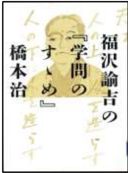
『福沢諭吉の「学問のすゝめ」』 橋本 治//著 〈002/ハ〉 本館所蔵

文豪作品は「学校の授業で習った」、「難しそう」など、気軽に読むイメージがないように思います。しかし近年、文豪をモチーフにしたゲームやアニメ、漫画などが話題になり、文豪作品を読む方が増えているようです。今回は明治時代の作品、文豪の逸話など集めてみました。ぜひ手に取ってみてください。