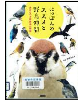
『にっぽんのスズメと野鳥仲間』 〈488.2/ニ〉 本館所蔵