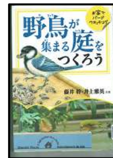
『野鳥が集まる庭をつくらう』 〈488.1/フ〉 本館所蔵

愛鳥週間は「野鳥（自然の中で生活している鳥）を大切にし、守ろう」という考えを広めるために作られました。散歩に行ったときに、どんな鳥がいるか探してみましょ。図鑑があれば、図鑑と見比べて調べてみたりすると、いろいろな発見を楽しめるきっかけになりますね。